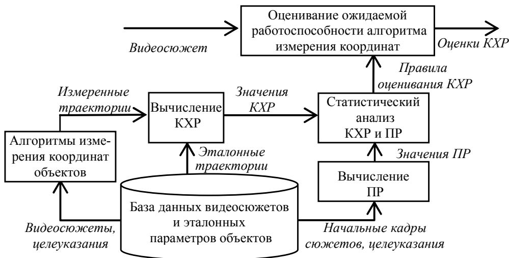
Рисунок 2 – Оценивание ожидаемой работоспособности алгоритмов измерения координат объектов

Структура предлагаемого подхода к оцениванию ожидаемой работоспособности алгоритмов приведена на рисунке 2.